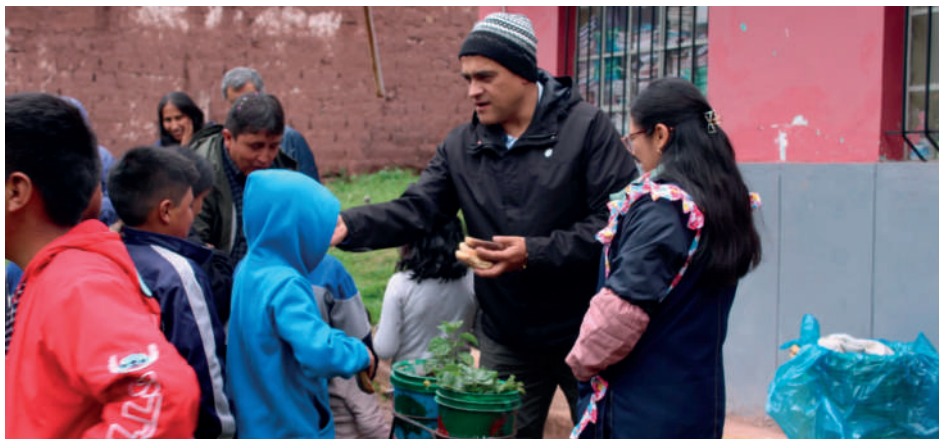
Matrimonio Bustos msp, en el pueblo de Rayanniyoc.