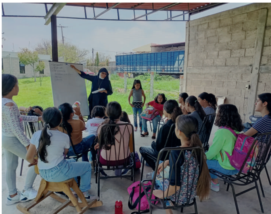
Hermanas MSP realizando su misión en el Oratorio con niñas adolescentes en Guadalajara (México).

Allí cada sábado tenemos un momento de Adoración Eucarística en el que las niñas participan por grupos, ingresando a la capilla con la Hermana encargada de su respectivo grupo. Ellas cantan, reflexionan en un momento de silencio y hacen la comunión espiritual.