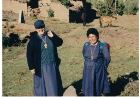
Las hermanas MSP, al principio de la misión, visitaban el pueblo de Punacancha y a las familias que habitan allí.

En Punacancha la condición de los pobladores en general era de una pobreza extrema, alimentada por el vicio del alcohol de su gente, el maltrato a las mujeres y a los niños y el abandono total de los ancianos. Punacancha era un pueblo sin ningún deseo de superación y con un desinterés general por salir de su triste situación. Por donde uno mirase había carencias: malnutrición, enfermedades, vicios, etc.