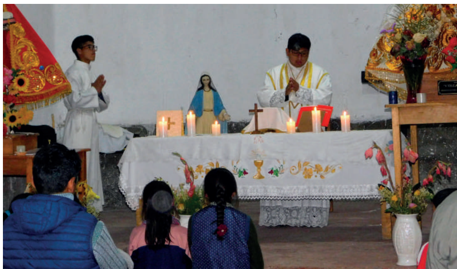
Las familias de los jóvenes que se encuentran en formación vocacional periódicamente visitan a sus hijos y participan de la celebración de la Santa Misa - Ciudad de los Muchachos, Andahuaylillas (Cuzco-Perú).

A finales de abril y principios de mayo hemos tenido una situación un poco particular, ya que hemos vivido dos terremotos muy cercanos el uno del otro, ambos con una potencia de hasta cinco sobre la escala de Richter. Eso ha provocado daños en la casa y ha obligado a trasladar a los chicos a otro lugar durante un período de un mes. Les pedimos que los encomienden a Dios en sus oraciones.