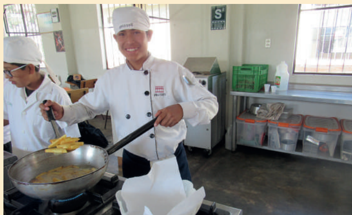
Los jóvenes del CETPRO, realizando sus actividades en sus respectivas especialidades - Ciudad de los Muchachos en Andahuaylillas (Cuzco-Perú)