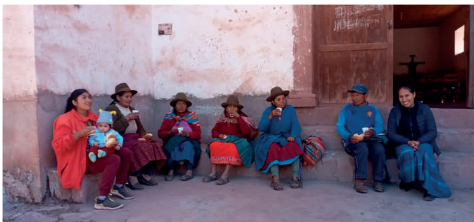
Matrimonio Alvarez msp, en el pueblo de Kallarayan.

Al visitar a cada familia, le dejamos la estatua de Santa María Madre de los Pobres, para que cada día y durante una semana esta familia se reúna en oración alrededor de nuestra Madre Santísima.