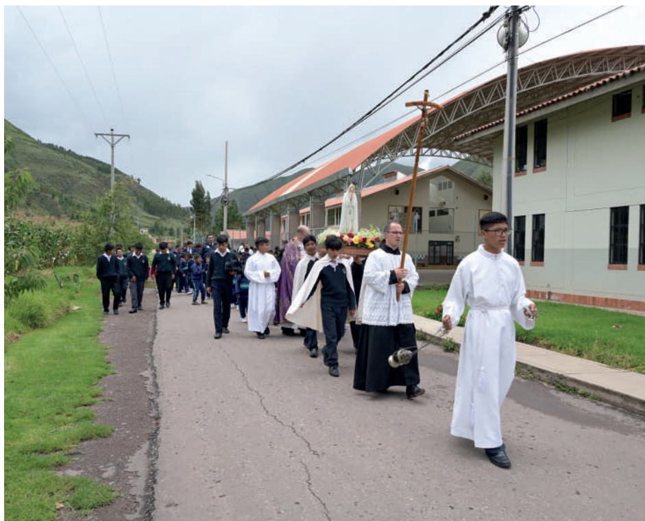
Alumnos del Colegio FJM, Ciudad de los Muchachos - Andahuaylillas (Cuzco-Perú).