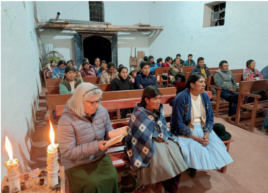
Matrimonio Barazorda msp, en el pueblo de Chitapampa.

El apostolado que inicialmente realizamos es visitar a las familias en sus casas, para conocer sus dificultades y especialmente para apoyarlos en lo espiritual, aconsejándoles que reciban los Sacramentos, porque hay muchos que no están casados por la Iglesia o cuyos hijos no han recibido ningún Sacramento (Bautizo, Primera Comunión, Confirmación, etc.). Queremos que, con nuestra ayuda a la medida de nuestras posibilidades, todas estas personas que se encuentran desorientadas, regresen al redil y puedan vivir bajo la mirada de Nuestro Señor Jesucristo y bajo la protección de Nuestra Madre María Santísima.