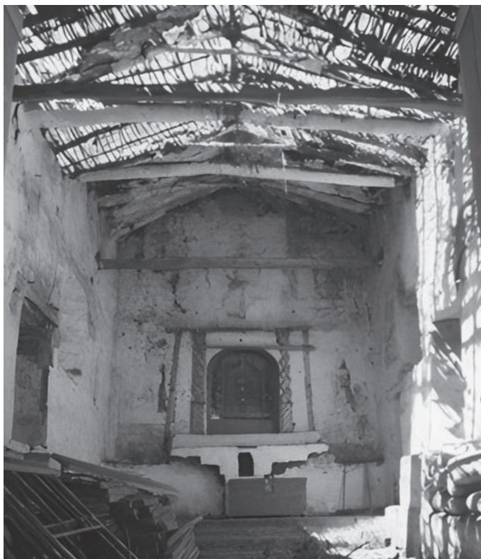
Condición de la Iglesia de Punacancha al inicio de la Misión.