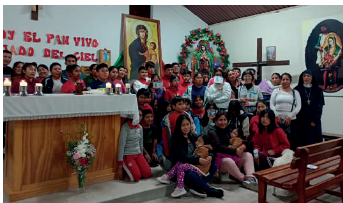
Hermanas MSP en sus diferentes actividades en la misión de Ilo (Perú).

Todos los sábados continuamos con el Oratorio. En estos meses se incrementó el número de niños que vienen del colegio “Santa Elizabeth” y de otros colegios. Seguimos haciendo visitas a las familias en las zonas de nuestra misión, tratando de llevar la Palabra de Dios sobre todo a aquellos que no disponen de medios para acercarse a la iglesia, como sucede a menudo con los ancianos.