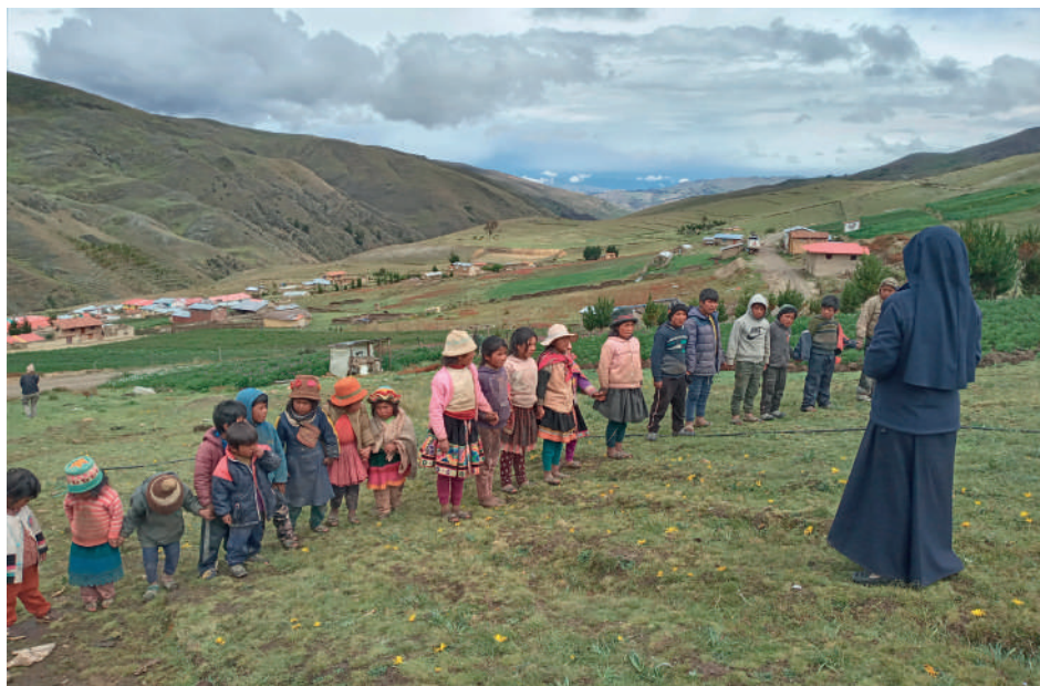
Poco a poco el interés del pueblo iba creciendo.

Fue así que, exactamente el 11 de abril del 2010, Domingo de la Divina Misericordia, la nueva fundación de Hermanas empezó a quedarse de forma permanente en Punacancha y fue una ocasión propicia para establecer el “Centro Asistencial Divina Misericordia” para los niños del pueblo. Establecernos como comunidad fue un gran reto, ya que la casa necesitaba muchos arreglos y hacían falta algunas cosas básicas. Incluso, un día antes de mudarnos recién terminaron de pintar las habitaciones refaccionadas, por lo que nos tocó dormir nuestra primera noche con un fuerte olor a pintura fresca.