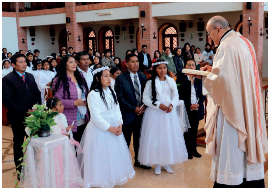
Niñas, niños y personas adultas preparados por las hermanas MSP, que realizan su Bautizo, Primera Comunión en el Hogar Sta. Teresa de Jesús. Cuzco-Perú.

También tenemos la alegría de compartir que en el campus misionero de este año tenemos la presencia de 7 chicas de diferentes nacionalidades que realizan una experiencia misionera apoyando en el cuidado de nuestros niños del Hogar y participando con nuestras Hermanas en las misiones a diferentes pueblos de la alta Cordillera.