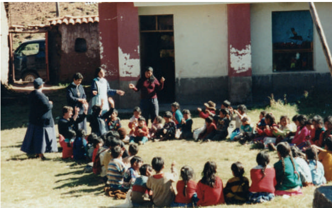
Hermanas MSP, dando catequesis a los niños de la población de Punacancha.

hermanos separados empezaron a impartir sus enseñanzas y a aplicar sanciones a los que no cumplían las promesas hechas a su pastor, diciéndoles además que Dios les castigaría. Fueron tiempos de mucha adversidad y el desánimo se fue apoderando no sólo de los pocos católicos que perseveraban, sino también del grupo de las Hermanas que habían visto a todas esas personas acercarse a Dios, rezar, recibir los sacramentos y ahora se mostraban reacios a aceptar nuestra fe. En nosotras las Hermanas nuestro compromiso con Dios fue más fuerte que el desánimo y por gracia de Dios no desistimos de esta misión.