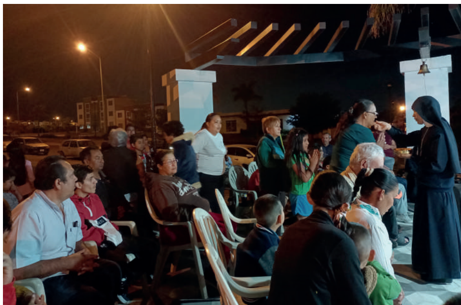
Hermanas MSP ayudando en Parroquias, Guadalajara (México).

Cuando retomamos el Oratorio después de la pandemia, las niñas estaban más inquietas en la capilla y no podían estar tranquilas ni 5 minutos, sobre todo las pequeñas. Con el paso del tiempo la situación ha mejorado: ahora las niñas ya entran con reverencia a la capilla, hacen silencio y cantan. Hemos observado que, en estos momentos de silencio, las niñas hablan con Jesús, algunas con más fervor que otras. Lo importante es que ellas poco a poco están sabiendo conversar con Jesús desde su tierna edad, lo que les ayudará y sostendrá en el futuro. Para nosotras es una gran alegría saber que nuestras niñas poco a poco se acercan más a Dios: algunas, incluso, se han comprometido a servir de monaguillas en la parroquia, dando a entender que el Señor está haciendo su trabajo en sus corazones. Esperemos que esta semillita se desarrolle y dé fruto.